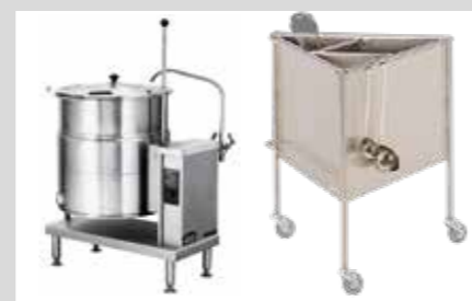
PRODUKTNAVN KIPGRYDE: Bistro Manu 940 Imo Alka 910