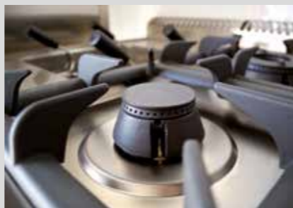
PRODUKTNAVN Bistro Manu 940 Imo Alka 910 Desinfect O