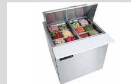
PRODUKTNAVN Bistro Manu 940 Maskinopvaskopvaskemiddel Desinfect O