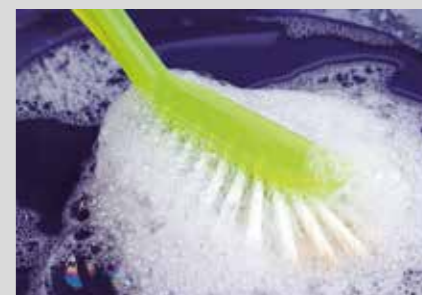
PRODUKTNAVN Bistro CL 341 Bistro Alu CL 342 Bistro Rinse 780 Bistro Rinse 380

Bistro Rinse 380: Nedbryder vandets overfladespænding i skyllefasen og efterlader servicet skinnende blankt. Derudover har Bistro Rinse 380 en forebyggende effekt over for kalkbelægninger i opvaskemaskinen.