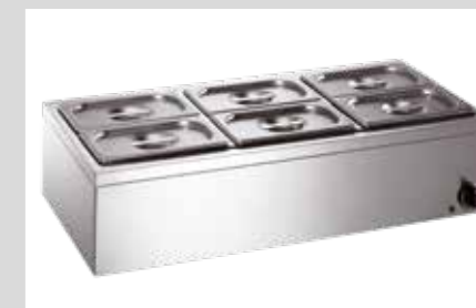
PRODUKTNAVN Bistro Manu 940 Desinfect O