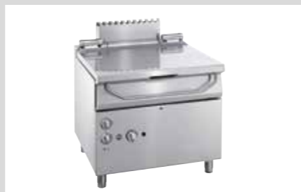
PRODUKTNAVN Imo Alka 910 Desinfect O