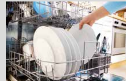
PRODUKTNAVN Bistro 741 Bistro Alu 742 Bistro Rinse 780 Bistro Rinse 380

Bistro Rinse 380: Nedbryder vandets overfladespænding i skyllefasen og efterlader servicet skinnende blankt. Derudover har Bistro Rinse 380 en forebyggende effekt over for kalkbelægninger i opvaskemaskinen.