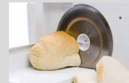
PRODUKTNAVN Bistro Manu 940 Maskinopvask (se side 3) IPA Sprit 70%