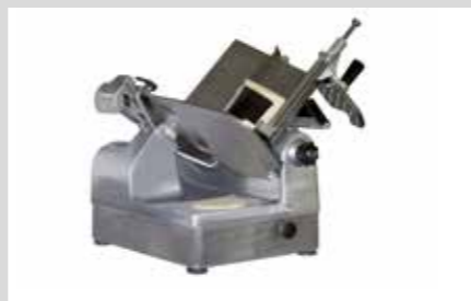
PRODUKTNAVN Bistro Manu 940 Imo Alka 910 Desinfect O IPA Sprit Wipes