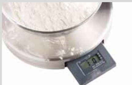
PRODUKTNAVN Bistro Manu 940 Desinfect O