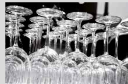
PRODUKTNAVN Bistro Rinse 780 Bistro Rinse 380

Bistro Rinse 380: Nedbryder vandets overfladespænding i skyllefasen og efterlader servicet skinnende blankt. Derudover har Bistro Rinse 380 en forebyggende effekt over for kalkbelægninger i opvaskemaskinen.