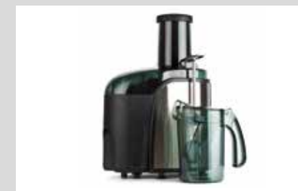
PRODUKTNAVN Bistro Manu 940 Maskinopvask (se side 3) Desinfect O