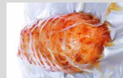
PRODUKTNAVN Imo Alka 910 Foam Alka 334 Maskinopvaskopvaskemiddel