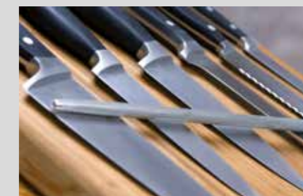
PRODUKTNAVN Bistro Manu 940 Maskinopvask Desinfect O

REDSKABER: (Sprøjteposser f.eks. remonce og borgmestermasse). Husk at hænge den på et tørrestativ