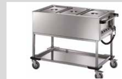
PRODUKTNAVN Bistro Manu 940 Maskinopvaskopvaskemiddel Imo Alka 910 Desinfect O