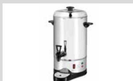
PRODUKTNAVN Bistro Manu 940 Imo Alka 910 Lime 374