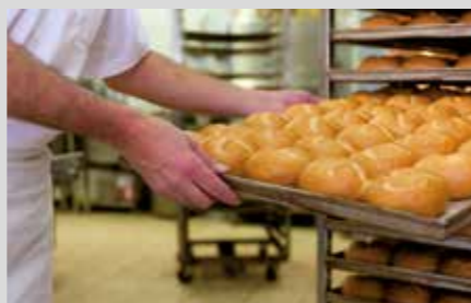
PRODUKTNAVN MANUEL RENGØRING Imo Alka 910 IPA Sprit 70% Wipes