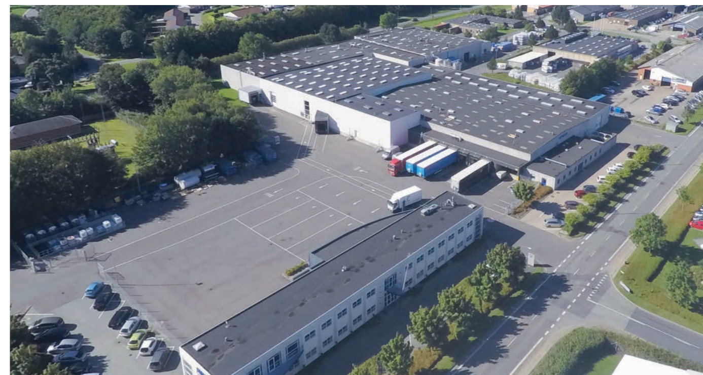
NOVADAN - INSTALAÇÕES DE PRODUÇÃO