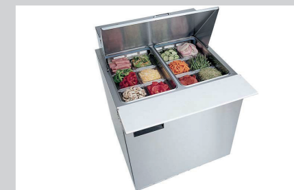
PRODUKTNAVN Bistro Manu 940 Maskinopvaskopvaskemiddel Desinfect O