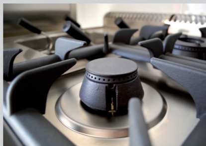
PRODUKTNAVN Bistro Manu 940 Imo Alka 910 Desinfect O