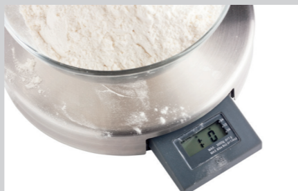
PRODUKTNAVN Bistro Manu 940 Desinfect O