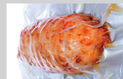
PRODUKTNAVN Imo Alka 910 Foam Alka 334 Maskinopvaskopvaskemiddel