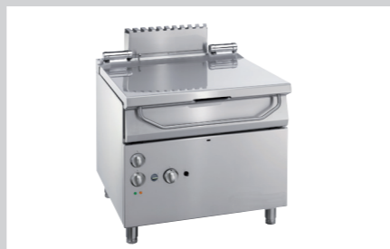
PRODUKTNAVN Imo Alka 910 Desinfect O