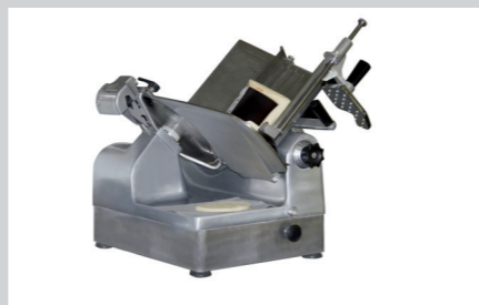
PRODUKTNAVN Bistro Manu 940 Imo Alka 910 Desinfect O IPA Sprit Wipes