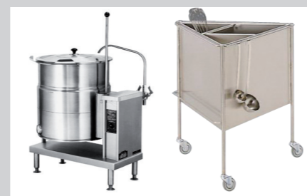
PRODUKTNAVN KIPGRYDE: Bistro Manu 940 Imo Alka 910