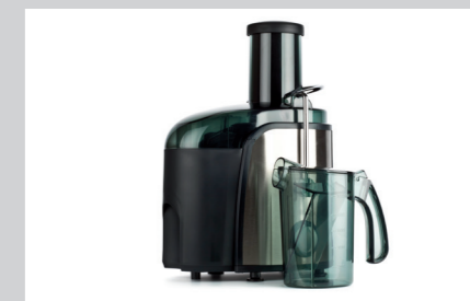
PRODUKTNAVN Bistro Manu 940 Maskinopvask (se side 3) Desinfect O