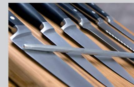
PRODUKTNAVN Bistro Manu 940 Maskinopvask Desinfect O

REDSKABER: (Sprøjteposer f.eks. remonce og borgmestermasse). Husk at hænge den på et tørrestativ