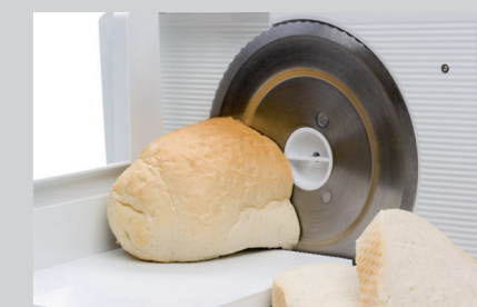
PRODUKTNAVN Bistro Manu 940 Maskinopvask (se side 3) IPA Sprit 70%