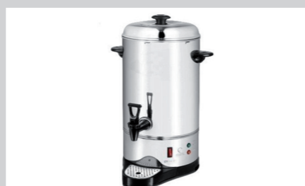
PRODUKTNAVN Bistro Manu 940 Imo Alka 910 Lime 374