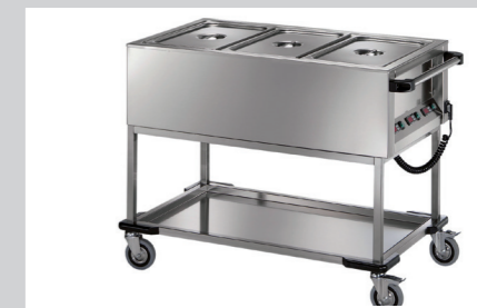
PRODUKTNAVN Bistro Manu 940 Maskinopvaskopvaskemiddel Imo Alka 910 Desinfect O