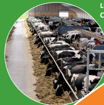
Liellopu aizgaldi Cūku aizgaldi

Katru reizi, kad kūkas tiek izdzītas no aizgaldiem, izstrādājumu var lietot tieši uz līstītēm un tīrīšanas laikā noskalot.